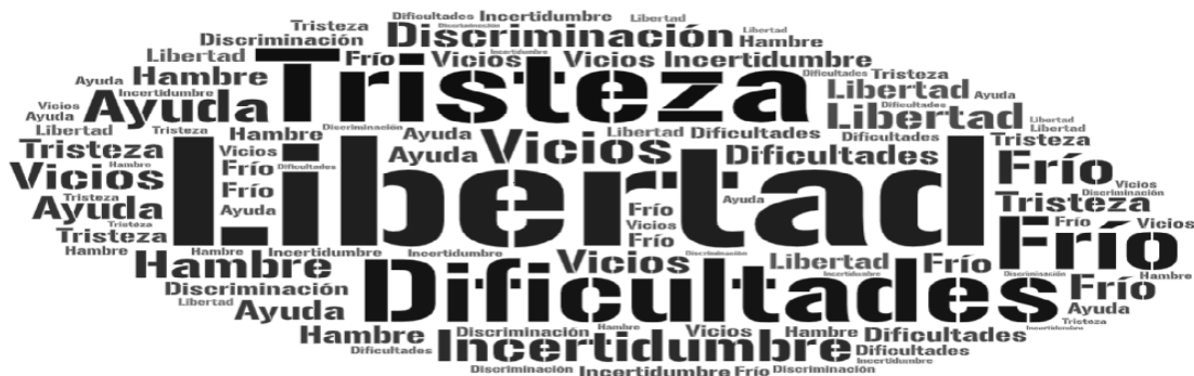
Figura 1 Nube de palabras construida con las frecuencias de los conceptos asociados por las personas en situación de calle.

Los resultados de la investigación se presentan mediante la exposición detallada de los datos recabados, en línea con las variables y dimensiones definidas en el marco teórico, así como los objetivos previamente establecidos. Se incluyen nubes de palabras que se conforman según la frecuencia de aparición de los términos, acompañadas de sus respectivos análisis. De esta forma, se revelan los hallazgos obtenidos en el estudio.