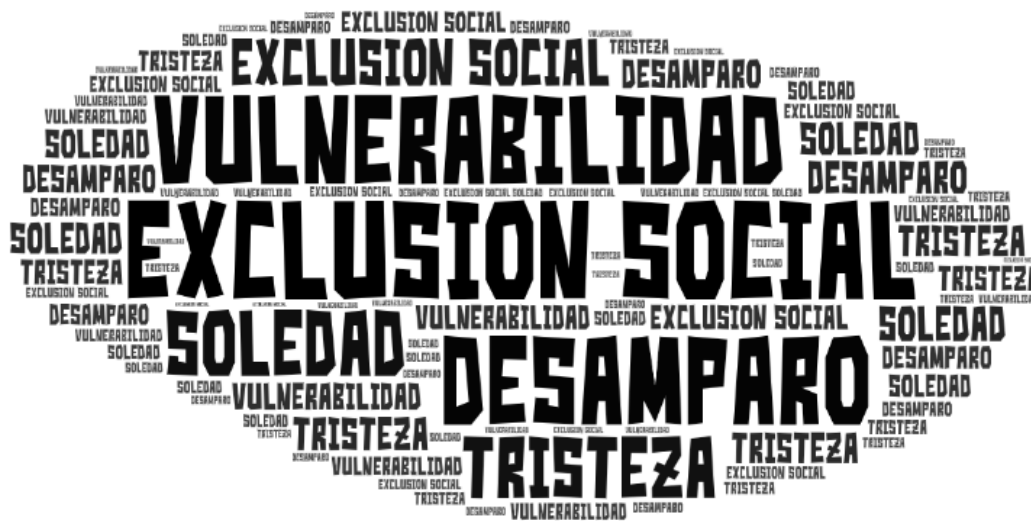
Figura 2 Nube de palabras construida con las frecuencias de los conceptos asociados por los trabajadores de los programas de la red calle, en colaboración del Ministerio del Ministerio de Desarrollo Social y Familia.

A partir de la Figura 1, se logra visibilizar las vivencias, experiencias y percepciones de las personas en situación de calle respecto al fenómeno que enfrentan diariamente. Utilizando las palabras recabadas, se procede a realizar un análisis de conglomerados jerárquicos, basándose en las percepciones de los individuos acerca de la situación de calle. Como resultado de este análisis, se identifica que la palabra 'libertad' es la de mayor frecuencia, destacándose como un concepto central en las narrativas de las personas afectadas por este fenómeno.