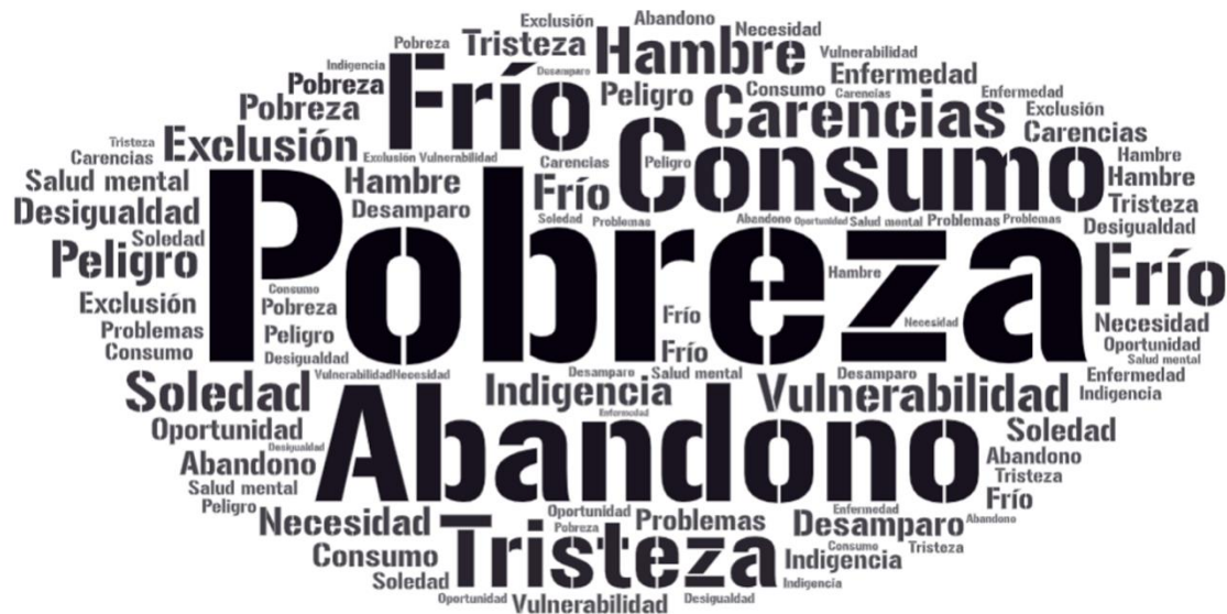
Figura 3 Nube de palabras construida a partir de los conceptos asociados por las personas que han participado en el estudio al pensar en el concepto situación de calle.

Como se ilustra en la representación gráfica de la nube de palabras, los términos más recurrentes están vinculados al fenómeno de la situación de calle. Esta observación revela un relato construido a partir de las representaciones e interpretaciones percibidas por las personas afectadas. Estas palabras se emplean posteriormente para llevar a cabo un análisis de conglomerados jerárquicos, basado en las percepciones de los individuos sobre la situación de calle, permitiendo una comprensión más profunda de este fenómeno desde la perspectiva de quienes lo experimentan.